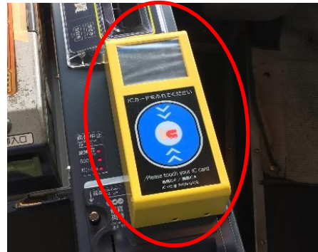
<降車時のICカードリーダー>

* IC O C Aのほか、全国相互利用交通系 ICカード（文末 ご参考）もご利用いただけます。