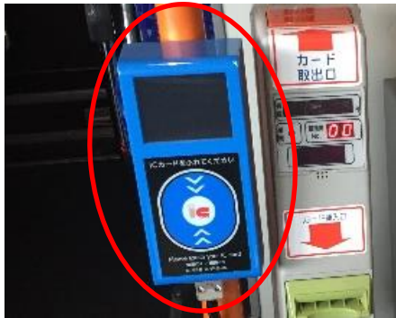
<乗車時のICカードリーダー>