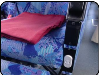
コンセント付 ※新装備車のみ