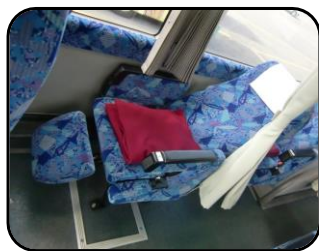
大型リクライニングシート