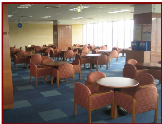
6階ロビー席（1テーブル4人掛けとなります。）